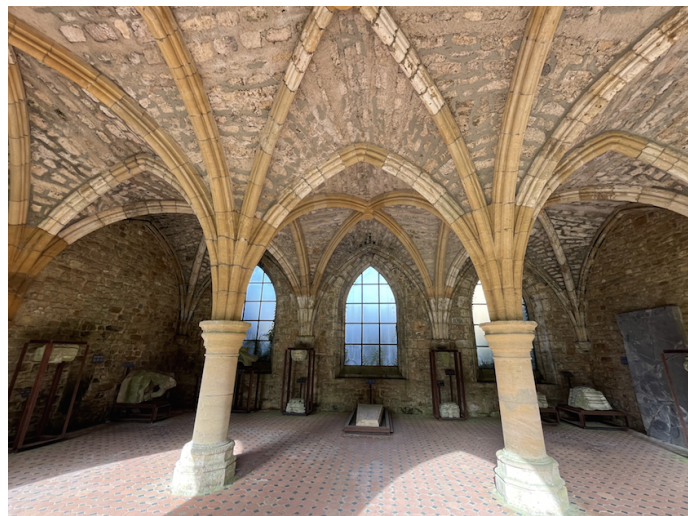
Abbazia di Orval e sopra quella di Scourmont

Nell’ Abbazia di Notre-Dame de Scourmont , situata nei pressi della cittadina di Chimay , lunedì 22 aprile 2024 alle ore 16 comincerà la nostra sesta tappa con la visita guidata all’interno del complesso monastico, famoso per la produzione della birra e di un formaggio – il Poteaupré – considerato uno dei migliori formaggi trappisti.