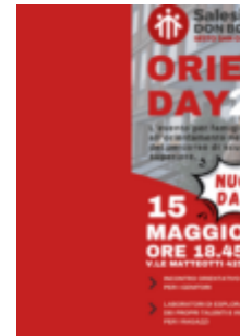
Salesiani Sesto annunciata nuova l’Orienta Day 20