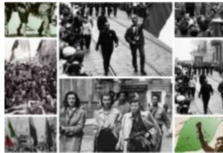
“XXV Aprile”: tre giorni di festa a Sesto con Anpi Aned e Ventimila Leghe